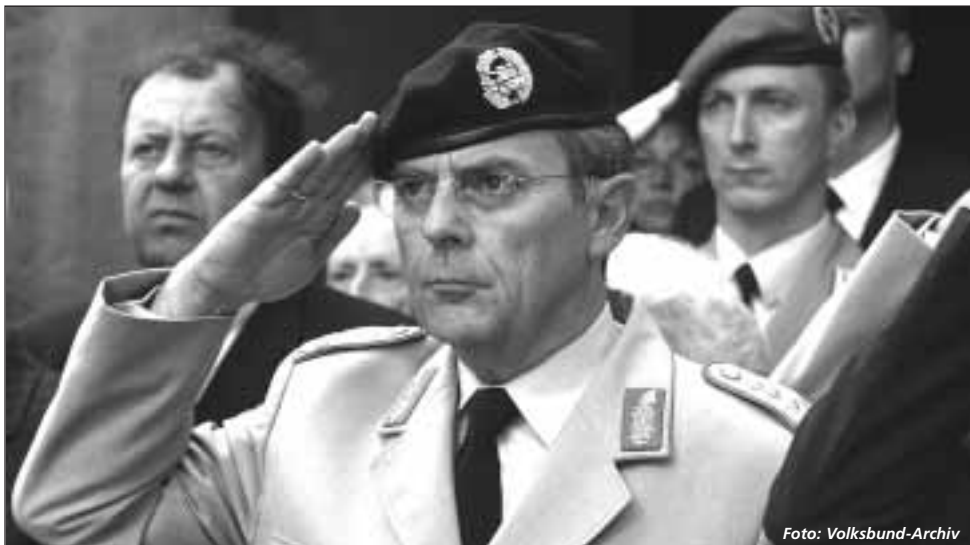
Generalinspekteur Schneiderhan auf der Kriegsgräberstätte Langemark/Belgien 2003

Auf der Einladungskarte zum Volkstrauertag 1971 heißt es beispielsweise: Es wird gebeten, nach der Totenehrung (damals gesprochen von Bundeskanzler Willy Brandt) so lange stehen zu bleiben, bis das „Lied vom guten Kameraden“ verklungen ist. Dieser Brauch gehört seit vielen Jahrzehnten zum unumstößlich festen Bestandteil dieser feierlichen Veranstaltungen. So wird auch am Volkstrauertag in diesem Jahr die Melodie an vielen Orten in unserem Lande zu hören sein.