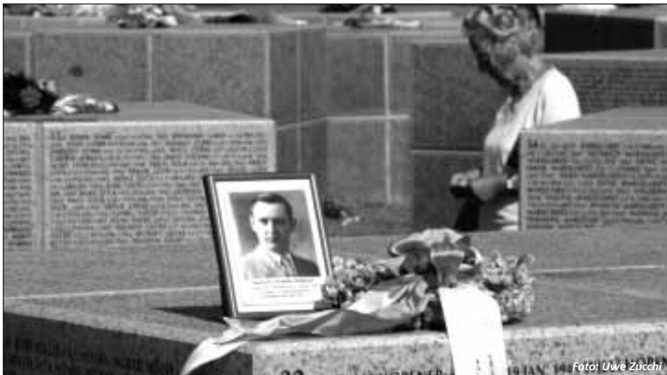
Namenwürfel für die Vermissten auf der Kriegsgräberstätte Rossoschka/Russland

Der Volkstrauertag, der jedes Jahr im November vom Volksbund bundesweit ausgerichtet und unter großer Anteilnahme wichtiger politischer und gesellschaftlicher Institutionen und der Bevölkerung begangen wird, ist ein Tag des Gedenkens und der Mahnung zum Frieden.